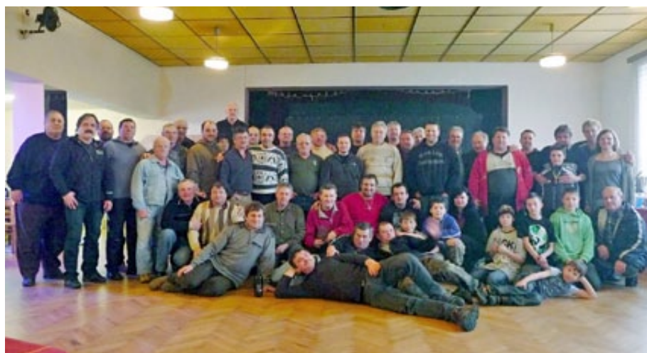
▲ SPOLEČNÉ FOTO ÚČASTNÍKŮ SOUTĚŽE V PLÍSKOVĚ