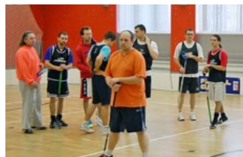
▲ TÝM BŘEZOVSKÝCH JUNIORŮ SE SOUSTRĚDUJE PŘED UTKÁNÍM

V sobotu dne 18. 2. 2012 se uskutečnil 2. ročník turnaje ve florbalu O pohár starosty města. Tento turnaj byl uspořádán v multifunkční hale. Zúčastnilo se celkem 6 týmů, které byly rozděleny do dvou skupin, ze kterých se podle postupového klíče odehrála kvalifikace o 1. - 3. místo. Naše Březová nasadila do turnaje 2 týmy (Březová senioři, Březová junioři), které byly nuceny díky rozložení svou kvalifikací odehrát ve stejné skupině. Březovské týmy patřily mezi favority turnaje, avšak chybělo jim trochu „sportovního štěstí“. Zajímavostí bylo, že tým z Kynšperka podpořil tamní starosta, který osobně odehrál všechny zápasy.