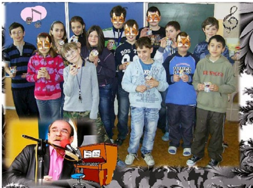
▲ 7. ÚNORA SI ŽÁCI 5. - 9. TŘÍDY ZAPÍVALI V SOKOLOVSKÉM DIVADLE S JAROSLAVEM UHLÍŘEM