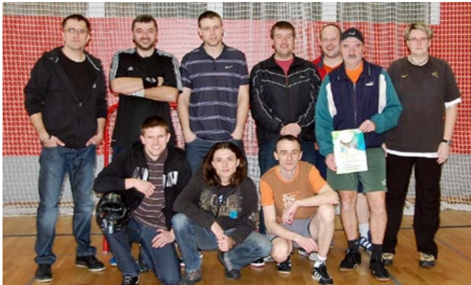
▲ TÝM BŘEZOVÁ - SENIOŘI

Město Březová vyhlašuje v souladu se zák. č. 561/2004 Sb. o předškolním, základním, středním, vyšším odborném a jiném vzdělávání (školský zákon), ve znění pozdějších předpisů a v souladu s vyhláškou 54/2005 Sb., o náležitostech konkursního řízení a konkursních komisích konkursní řízení na pracovní místo ředitele/ředitelky příspěvkové organizace Základní škola, Komenského 232, Březová.