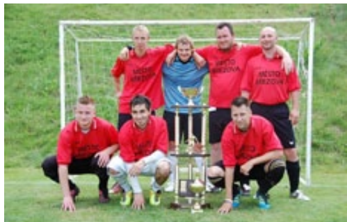
▲ CLUB BŘEZOVÁ

Léto na FK Olympii odstartoval turnaj v malé kopané „O pohár starosty města Březová“, který je na zdejší hřišti pořádán každoročně. Letos to byl již 15. ročník, ve kterém se utkalo dne 23. června celkem 20 týmů. Vítězem se po celodenním klání stal březovský tým Club Březová.