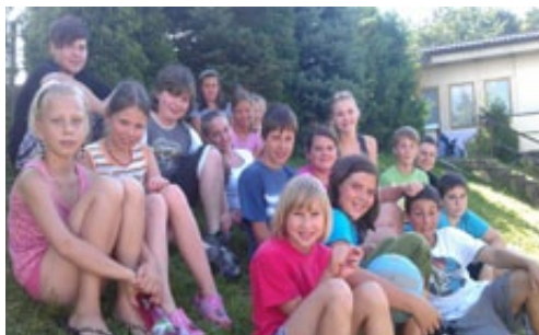
▲ MÁME SE TU DOBRĚ!

ně jsme si užily Stezku odvahy, kdy jsme svým jekotem probudily celou vesnici.