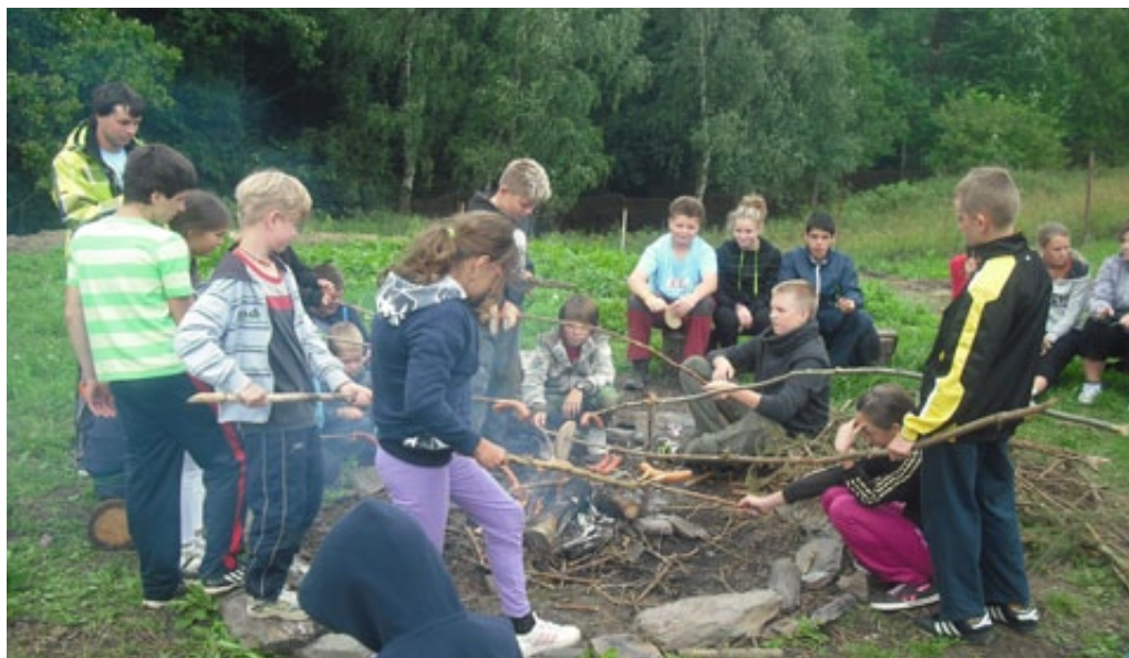
▲ OPÉKÁNÍ BUŘTŮ...

Přebráno od maminek a tatínků, babiček a dědečků, zamávat a hurá vstříc dobrodružství, smíchu a zábavě. Ubytováno, rozděleno do oddílů, seznamování se s ostatními a okolím. A plni dojmů všichni ulehají do pelíšků (někteří poprvé do spacáků) a těší se, co přinese nový den.