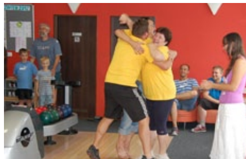
▲ EUFORIE NAD ÚSPĚŠNÝM HODEM V BOWLINGOVÉM TURNAJI