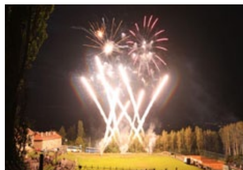
▲ NÁDHERNÝ OHŇOSTROJ NADCHL VŠECHNY ZÚČASTNĚNÉ BŘEZOVÁKY