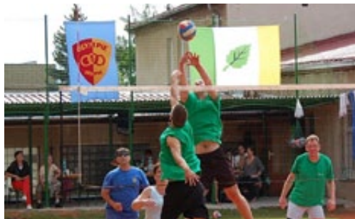
▲ BRATROVRAŽEDNÝ VOLEJBALOVÝ ZÁPAS MEZI BŘEZOVSKÝMI DRUŽSTVY