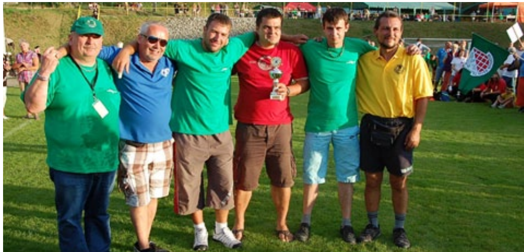
▲ NAŠI BŘEZOVŠTÍ HASIČI OBSADILI KRÁSNÉ DRUHÉ MÍSTO

Ještě jednou bychom se rádi vrátili k Setkání Březových a poděkovali touto cestou všem, kteří se na této velké akci podíleli. Nechceme nikoho jmenovat, protože bychom mohli na někoho zapomenout, a to bychom velice neradi. Díky nám všem se tato akce podařila a je účastníky z ostatních Březových hodnocena velice dobře, dokonce jako jedna z nejlepších. Jednoho však vyzdvihnout a poděkovat mu musíme – je to ten, kdo zařídil počasí! Bylo to neuvěřitelné, ale v okolních městech přšelo, bouřilo, ale u nás se jen dvakrát dešť spustil, ale to jen tak, že zkrápěl hřiště a tak ulehčil pořadatelům volejbalu a