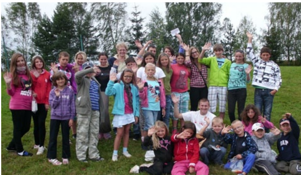
▲ A JE TO TADY. TÁBOR KONČÍ... AHOJ NA KOŘENU 2013!