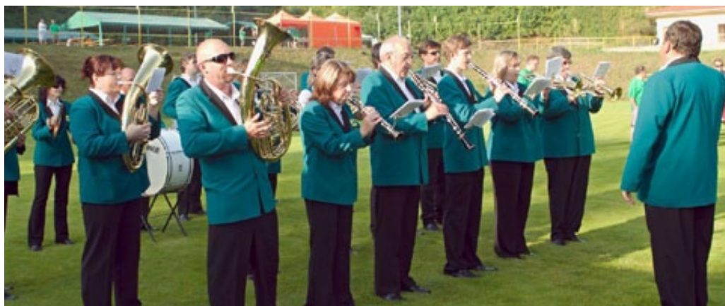
▲ BŘEZOVÁČEK HRAJE VŠEM BŘEZOVÝM