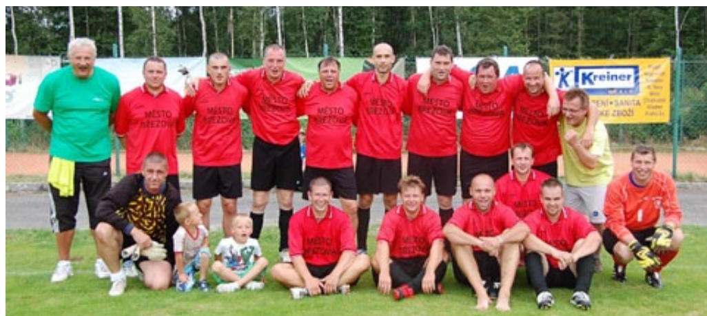
▲ BŘEZOVÁ MUŽI B