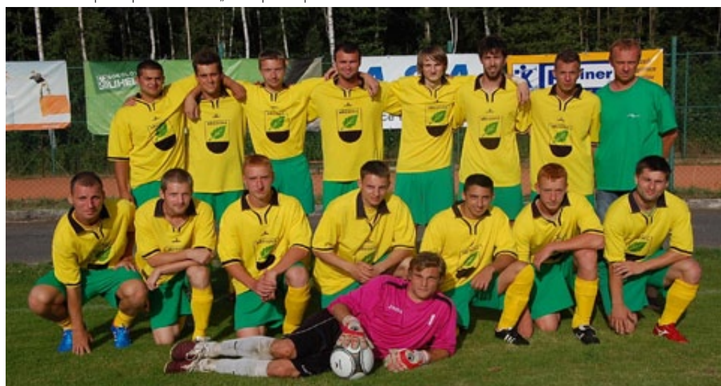
▲ VÍTEŽNÝ TÝM - BŘEZOVÁ MUŽI A

Muži „B“ v prvním mistrovském utkání prohráli na hřišti Krajkové 2:0.