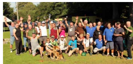
► Účastníci soutěže v Klatovech.