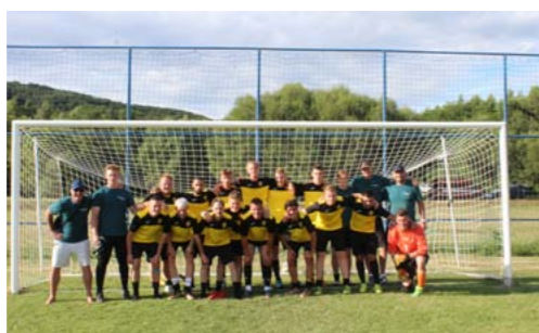
► Fotbalisté reprezentující naši Březovou.