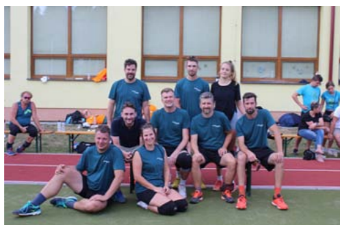
► Náš volejbalový tým.