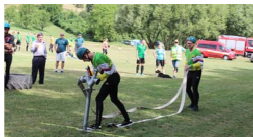
► Zástupci našeho SDH v akci.