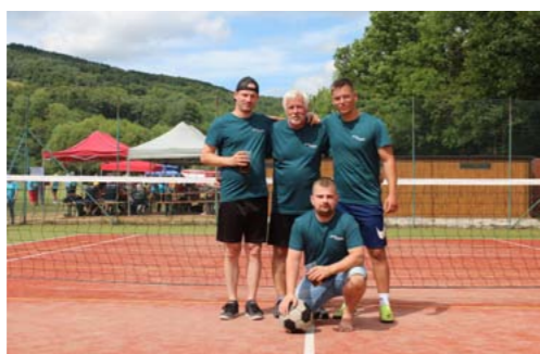
► Náš nohejbalové družstvo.