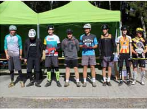
► NASTOUPENÁ ELITNÍ SKUPINA M ČR

Pořadatelé mohli soutěž uspořádat díky podpoře města Březová, Karlovarského kraje, společnosti FCC Česká republika, s.r.o. a též vstřícně materiálně technické podpoře státního podniku Lesy ČR. Pořadatelé všem podporovatelům, stejně jako členům zdravotnické služby, rozhodčím, pracov-